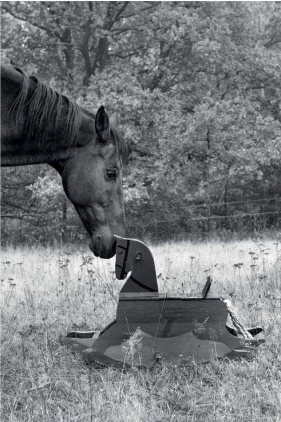
Roß und Hetscha-Pflaa

Gab es auch Reaktionen von außerhalb Bayerns? Kann man das Buch überhaupt außerhalb Bayerns kaufen? Band 1 und nun auch Band 2 von „Basst scho!“ sind in allen guten Buchhandlungen zu kaufen, auch bei Amazon im Internet. Begeisterte Reaktionen erfuhren wir von Lesern aus Freiburg im Breisgau, Bonn, Marburg und Hamburg – und sogar aus den USA.