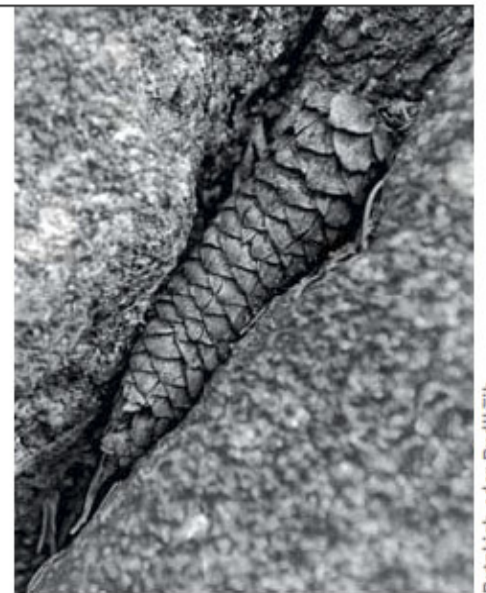
Butzkiah oder Budlkäih